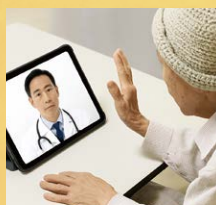
テレビ電話ナースコール