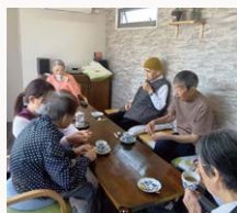
みんなでティータイム