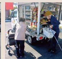
移動スーパーでお買物