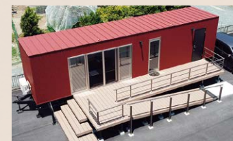
コミュニティルーム併設