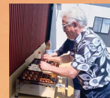
たこ焼きパーティ、オーナーが腕をふるいます